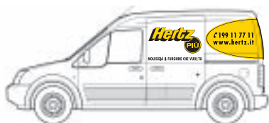
Ford Transit Connect 230L Group: B4