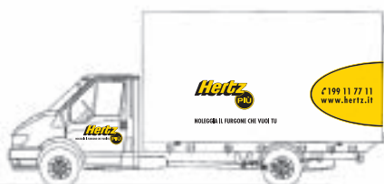
Ford Transit Chassis 350 EF Group: E4