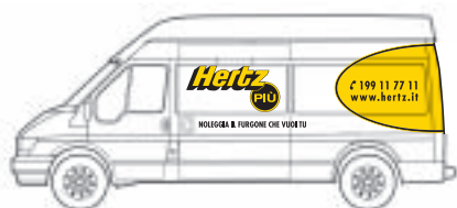
Ford Transit Van 350 L Group: D4